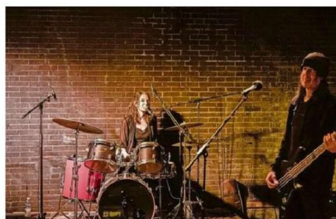
Het duo Allez Rater bezingt honderdtwintig miljoen ontheemde mensen