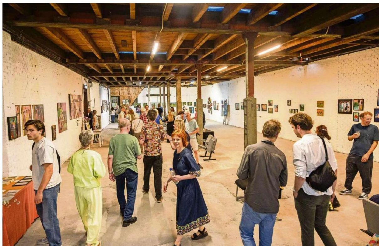
Expositie 023 Art Collective