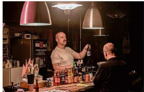
De bar in het Vrijheidstheater

kaanse muziek en in de flamenco gebruikt wordt. Op het podium staan een drumstel en versterkers klaar. De maandelijkse open podium- en jamsessie-avond van De Volharding.